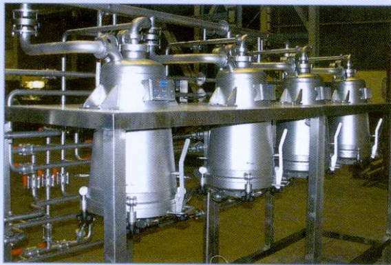
Pilot-Extraktionsanlage, die Sie zu Testzwecken nutzen können

Die Anwendungspalette ist sehr vielseitig. Damit bietet sich Ihnen die Möglichkeit, von Anfang an die richtige und wirtschaftliche Basis für die angestrebten Ergebnisse zu schaffen.