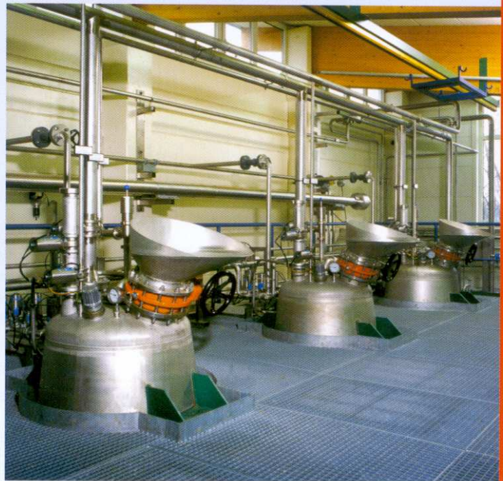
Extraktionsanlage mit Big-Bag-Befüllung